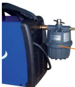
Přídavný vzduchový filtr Optional air filter