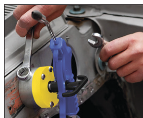
Prídrží skrutky, skrutkovače a všetko z kovu na ťažko dostupných miestach.