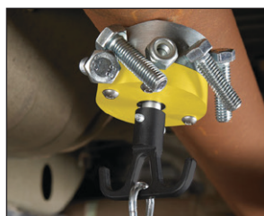
Pre ploché a oválne povrchy.