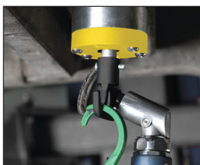
Šetrí váš čas, dobrá organizácia pracoviska.