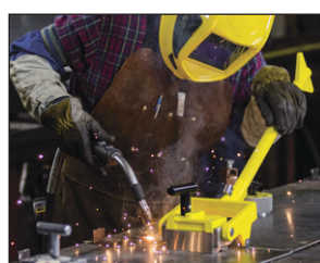
Nastavte nástroj na medzeru, zapnite magnet, stlačte pre zarovnanie. Zvárajte. Jednoduché a rýchle.