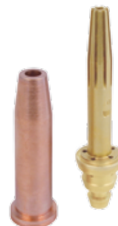
PNME ŘEZACÍ HUBICE