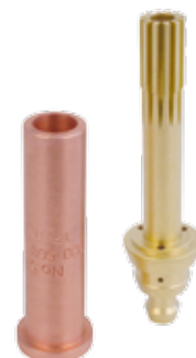
HP337 COOLEX® ŠROTOVACÍ ŘEZACÍ HUBICE