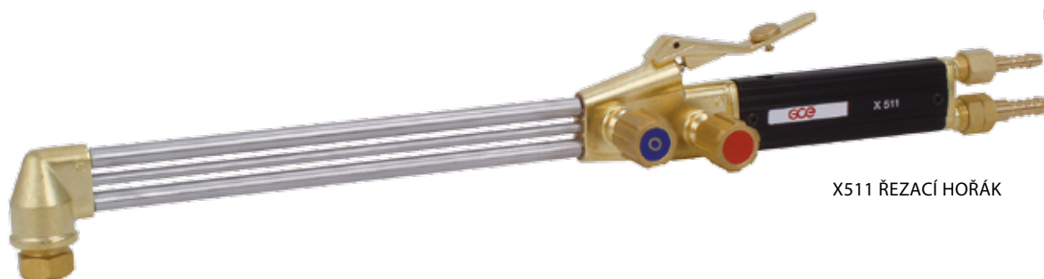
X511 ŘEZACÍ HOŘÁK