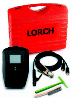
Prepravný kufor (pre MicorStick)

MicorStick a MobilePower 1 môžu byť prepravované ľahko a samostatne, pretože sú štandardne vybavené popruhom. Ďalšou možnosťou je použiť jeden zo šikovných systémov Lorch. Myslieť dopredu – pre neobmedzenú mobilitu.