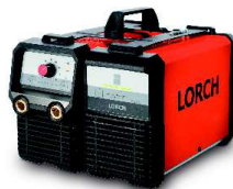
Easy Go 2 Systém spojenia MicorStick a MobilePower 1 vedľa seba