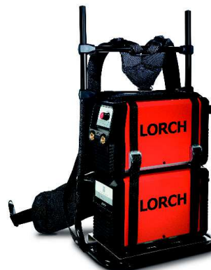
Zvárací batoh Komfortný batoh vrátanie hrudného pásu pre MicorStick a MobilePower 1