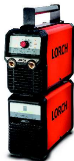
Easy Go 1 Systém spojenia MicorStick a MobilePower 1 jeden na druhého