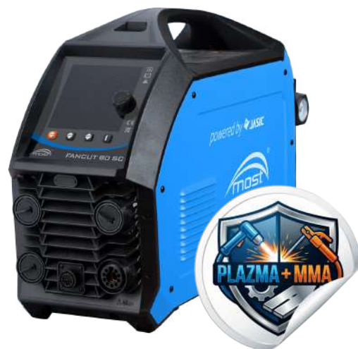
Przykładowe ustawienia parametrów cięcia plazmowego:

FANCUT 80SC może być zasilany z agregatu prądotwórczego z funkcją AVR.