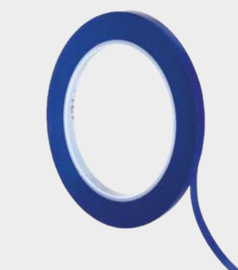
3M™ Konturovací maskovací pásky 471+