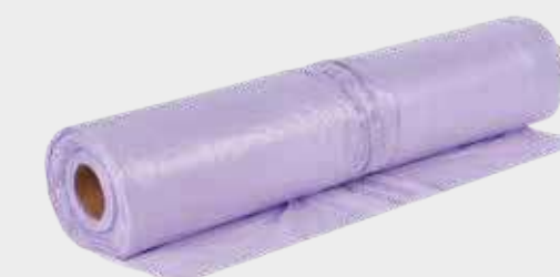
3M™ Fialová prémiová maskovací fólie PLUS 4 m x 150 m, 5 m x 120 m, 6 m x 120 m