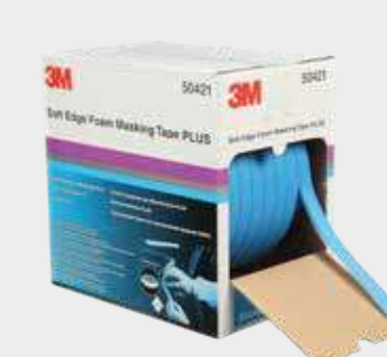
3M™ Pěnová maskovací páska PLUS s měkkým okrajem