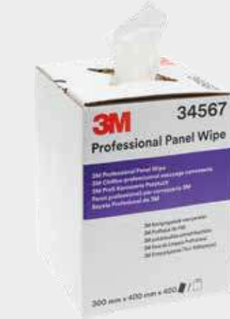
3M™ Profesionální utěrky na díly