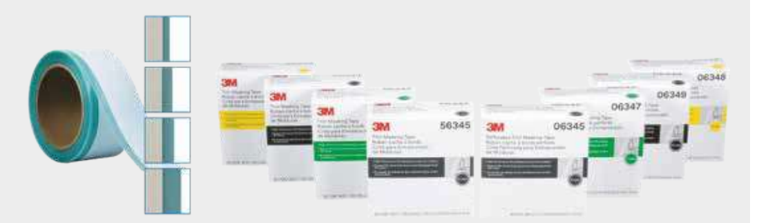
3M™ Lemovací maskovací páska