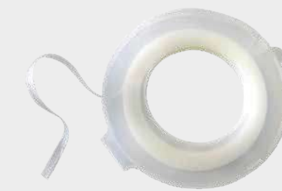
3M™ Jemná přechodová páska

Poznámka: Při maskování se vyvarujte vzniku ostrých okrajů. Ty způsobují viditelnost přechodu z důvodu koncentrace rozpouštědel na okrajích pásky.