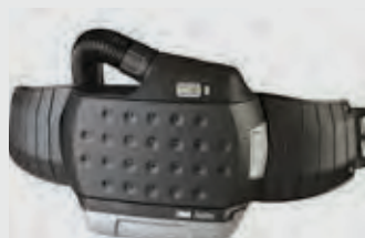
Jednotka bez tvárového štítu – batéria s predĺženou výdržou

V prípade konfigurácie s plynovým filtrom odporúčame použiť jednotku Adflo s vysokokapacitnou batériou.