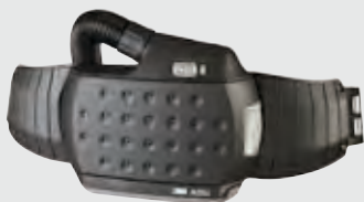
Jednotka bez tvárového štítu – štandardná batéria