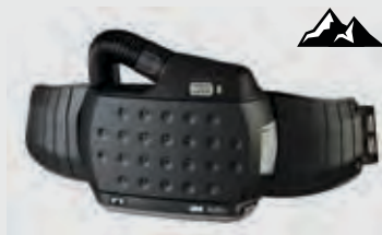
Jednotka na prácu vo vysokých nadmorských výškach – štandardná batéria alebo batéria s predĺženou výdržou

V prípade konfigurácie s plynovým filtrom rozšírite vyššie uvedenú objednávku o tieto položky: 83 72 42 pre plynový filter A1B1E1 alebo 83 75 42 pre plynový filter A2.