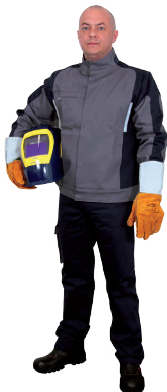
wariant z krótką kurtką