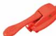
PER1LS Tlačítko 1 PARKER páčkové