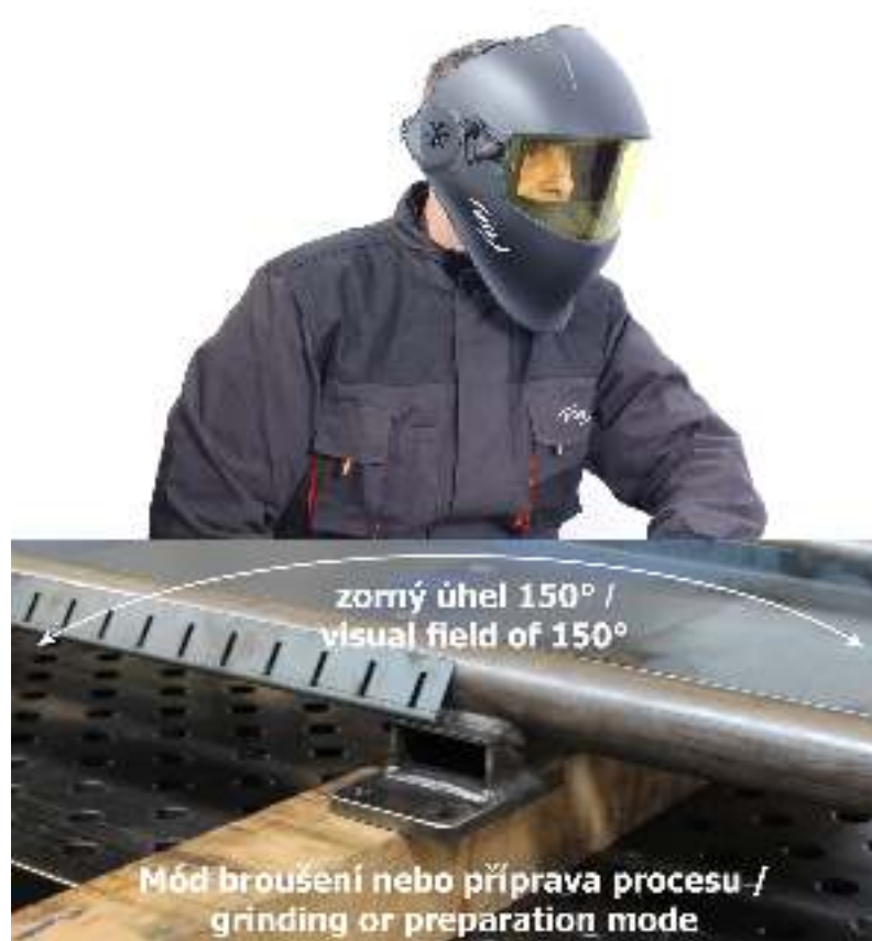
Obr.1 / Fig.1

The cartridge flips into the space between the head and hood of the helmet. The centre of gravity is kept as low as possible. This is very important to minimize fatigue during long-term use of the helmet. In the grinding/preparation mode, the view is clear, fully transparent and provides a visual field of 150°. This feature is useful not only for grinding but also for preparation, precise welding or in areas with reduced visibility (see Fig.1).