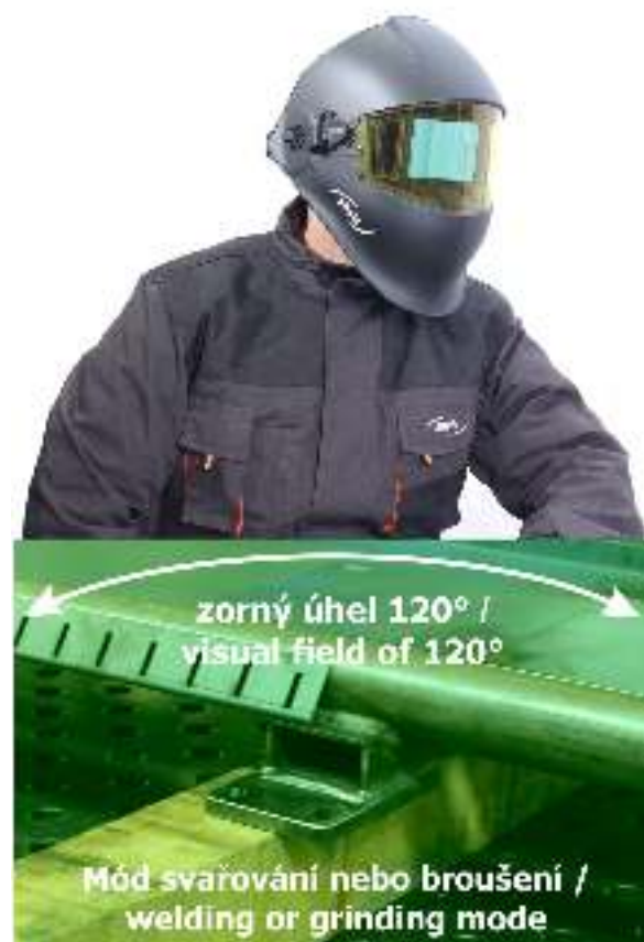
Obr.2 / Fig.2

Samostmívací kukla s odklopenou kazetou / Auto-darkening welding helmet with the cartridge in open position