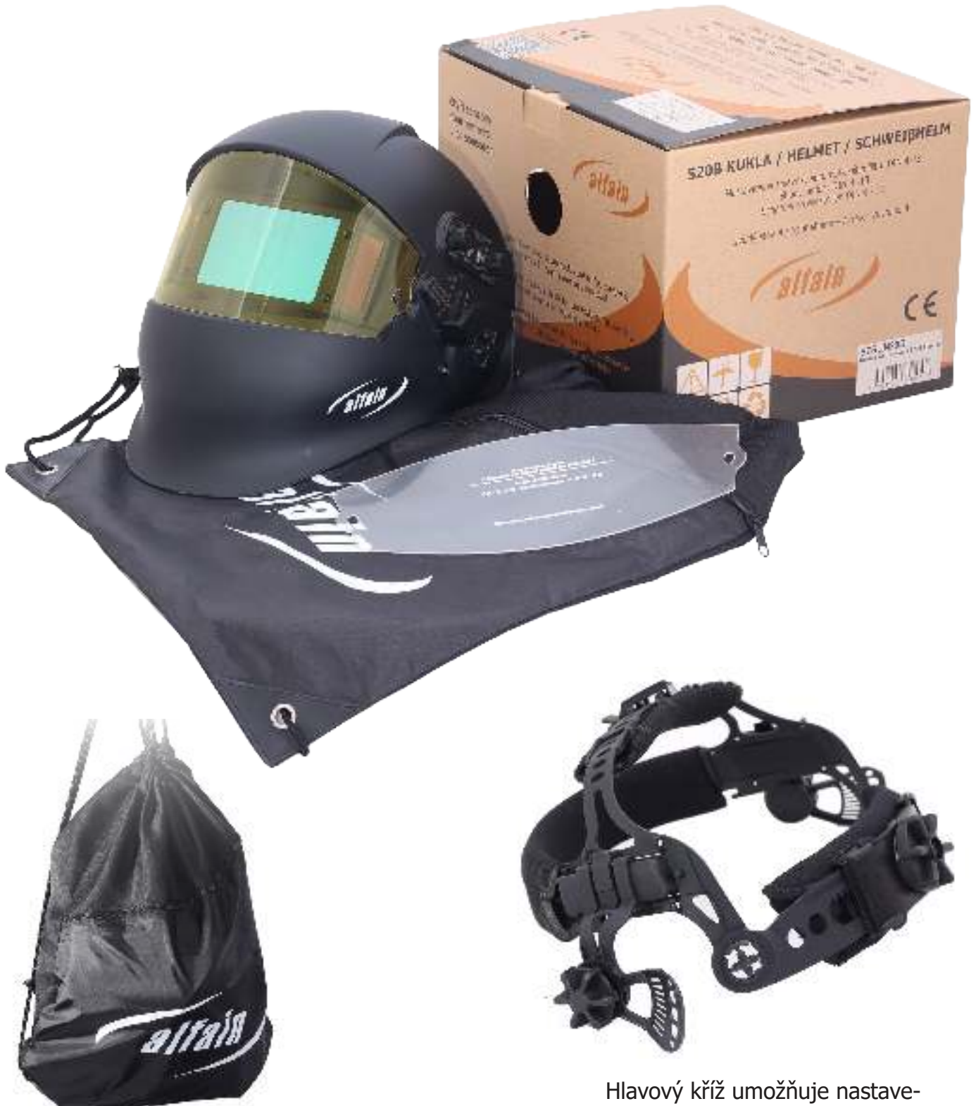
Pos. 18 Praktický vak / Practical bag

As standard, the helmet is supplied with a transparent outside shield, a yellow shield increasing visual acuity and practical bag with a pocket for spare shields. The helmet can be also equipped with a dioptr lens.